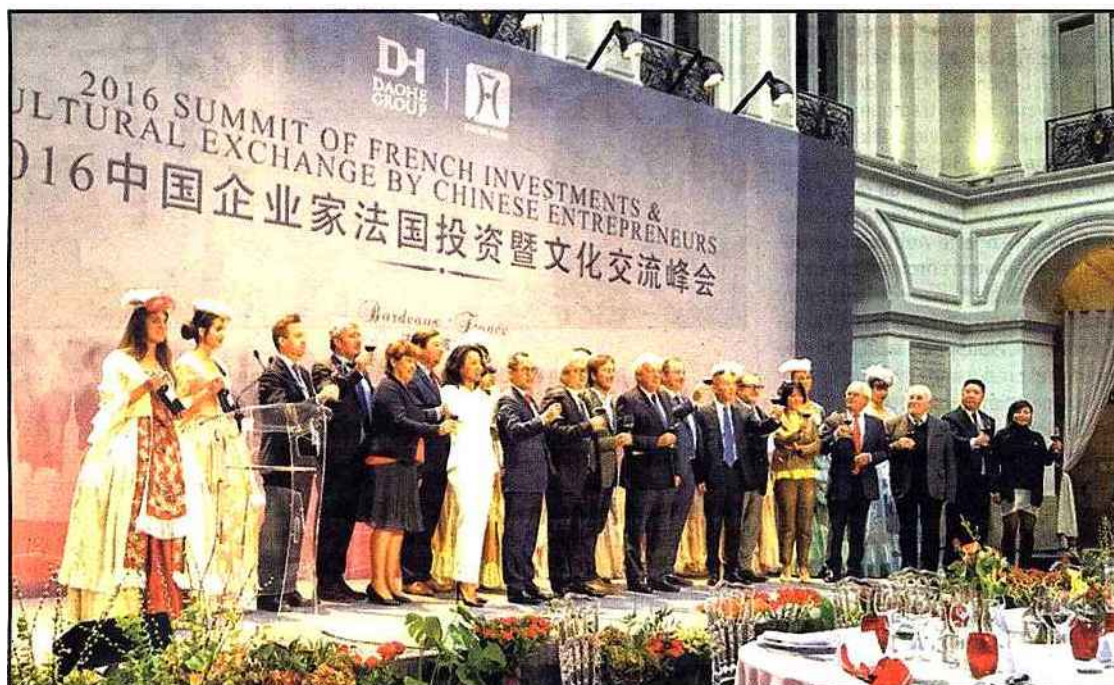
Le séjour des investisseurs chinois s'est terminé en grande pompe par un déjeuner au Palais de la Bourse.